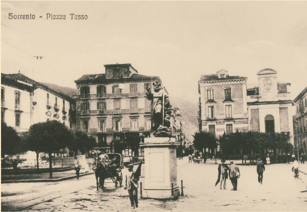
Sorrento - Piazza Tasso